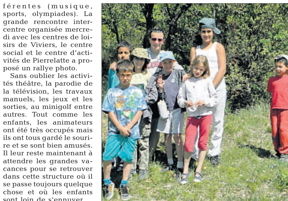
Un rallye photo a ponctué la rencontre inter-centre mercredi après-midi.

Sans oublier les activités théâtre, la parodie de la télévision, les travaux manuels, les jeux et les sorties, au minigolf entre autres. Tout comme les enfants, les animateurs ont été très occupés mais ils ont tous gardé le sourire et se sont bien amusés. Il leur reste maintenant à attendre les grandes vacances pour se retrouver dans cette structure où il se passe toujours quelque chose et où les enfants sont loin de s'ennuyer. □